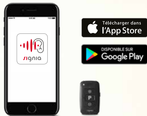
Application Signia App miniPocket

Connectez-vous avec la plus grande facilité.